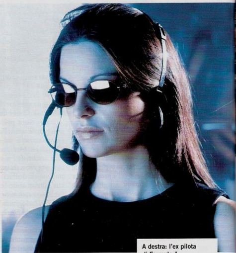
A destra: l'ex pilota di Formula 1 Alexander Wurz veste i panni di James Bond

I n un'epoca come la nostra, dove le tecnologie per comunicare la fanno da padrone, tutelare la privacy è sempre più complicato. Da tempo si trovano in vendita (o talvolta anche gratis) tantissimi strumenti che consentono di intercettare le telefonate (e in generale le comunicazioni) del nostro partner, del nostro concorrente sul lavoro e di qualunque altra persona vogliamo conoscere le conversazioni. Si tratta di strumenti più o meno legali (spesso usati da professionisti, come investigatori privati) e sono sia software (che si installano sul dispositivo - pc o telefonino - da intercettare) sia hardware (microspie e simili) disponibili a basso costo (al massimo qualche centinaio di euro) e acquistabili in maniera completamente anonima, per esempio via Internet.