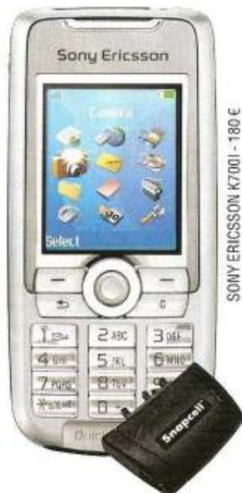
SONY ERICSSON K700I - 180 €