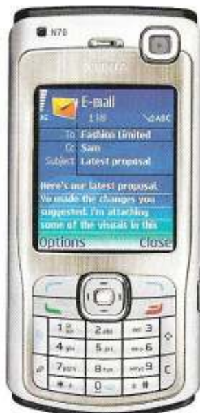
NOKIA N70 - DA 149 A 510 € (SECONDO GLI OPERATORI)

Tra le soluzioni che ho provato è quella che si collega al cellulare più alla svelta: attacchi la scatoletta e sei già pronto, senza dover installare alcun software. Inoltre fa arrivare la voce con meno ritardo rispetto agli altri sistemi. Qualche difetto, però, ce l'ha: puoi chiamare solo usando un auricolare e la procedura per telefonare è meno intuitiva del normale (devi attivare la modalità protetta dall'auricolare prima di comporre il numero). Inoltre funziona solo con alcuni cellulari Sony Ericsson (vedi il sito). www.snapcom.it