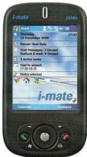
IMATE JAMIN - 549 €